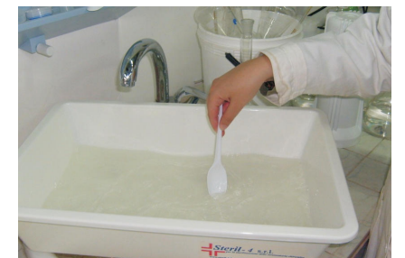
Figura 8 / Figure 8 / Figure 8 / Рис. 8