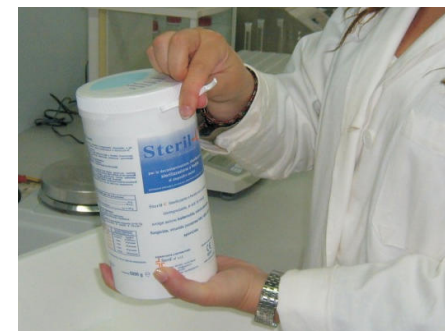
Figura 4 / Figure 4 / Figure 4 / Рис. 4