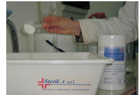
Figura 7 / Figure 7 / Figure 7 / Рис. 7