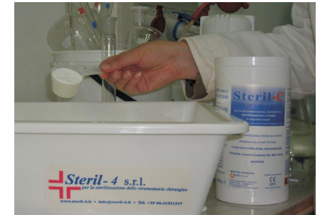
Figura 6 / Figure 6 / Figure 6 / Рис. 6