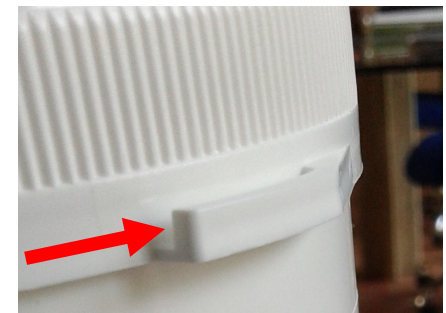
Figura 3 / Figure 3 / Figure 3 / Рис. 3

Чтобы открыть банку, поднять вверх выступающую часть крышки (рис. 5).