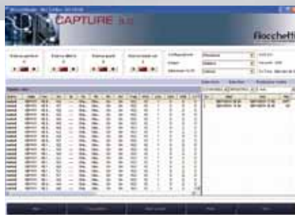
Software Capture 5.0 in dotazione su SD Card.