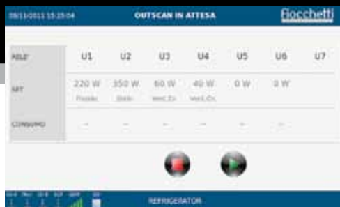
Monitoraggio automatico di tensione e corrente sui carichi.