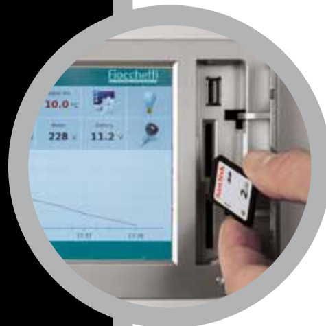
Registrazione dati su SD Card.