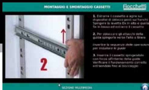
Visualizzazione di video istruzioni per il corretto utilizzo e manutenzione.