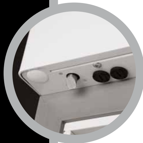
Elettroserratura per controllo accessi multiutente.