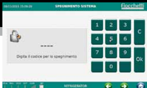
Protezione tramite password personalizzata.