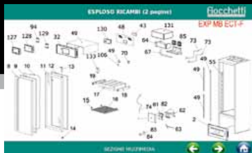
Accessibilità immediata a schemi elettrici ed esplosi ricambi.