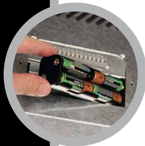
Batterie di back-up NiMh ricaricabili di facile sostituzione.