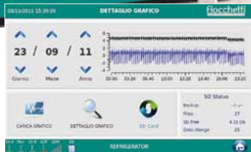
Grafico giornaliero delle temperature con ricerca per data.

Applicativo TUTORIAL: interfaccia integrata per visualizzare in qualsiasi momento i file multimediali utili sia all'utente (video istruzioni e manuale uso e manutenzione) che al service (schemi elettrici, esplosi ricambi).