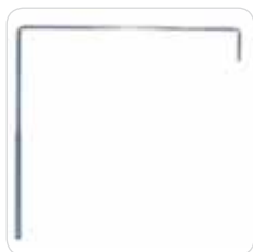
curtain-holder reggitelo cod. 315