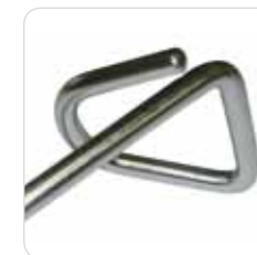
heel support couple coppia di reggi tallone