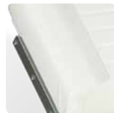
back medical guides guide medicali schiena cod. 317