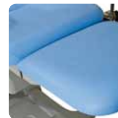
removable legrest gamba estraibile