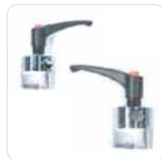
fixed and rotating clamps morsetti fissi e girevoli cod. 319-320