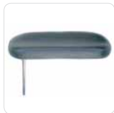
medical armrest couple coppia braccioli medicali cod. 313