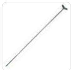
IV. rod asta porta flebo cod. 311