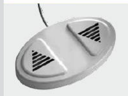
Pedaliera Pedal keyboard Command Pédalier