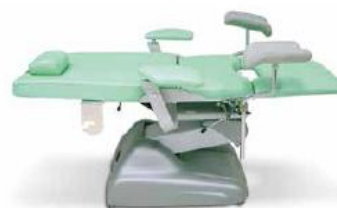
Poltrona da visita ginecologica e urologica Gynaecological and urological treatments chair Fauteuil gynécologie et urologie