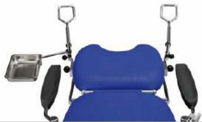
Poltrona ginecologica Gynaecological treatments chair Fauteuil gynecologie